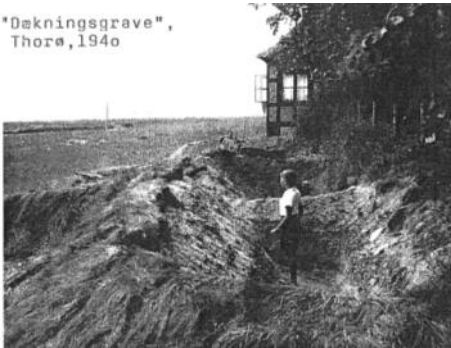
"Døkningsgrave", Thorø, 1940

Dette er fjerde og sidste indlæg om "Gammelodde" Thorøusere giv agt ! Betragt lokaliteten med Fiskerhytten og ankeret fra den engelske ubåd E 13 samt resterne af Hotchkiss revolverende maskinkanon med nostalgis blik, om føje år eksisterer disse ting sandsynligvis ikke mere, idet havstrømmene omkring Thorø tilsyneladende har ændret sig så meget, at Gammelodde nu virker stærkt truet ved vind og strømretning fra nordvest og langsomt bliver eroderet væk, hvis ikke Københavns Lærerforening "Kolonierne" vil bekoste en kystsikring på dette område.